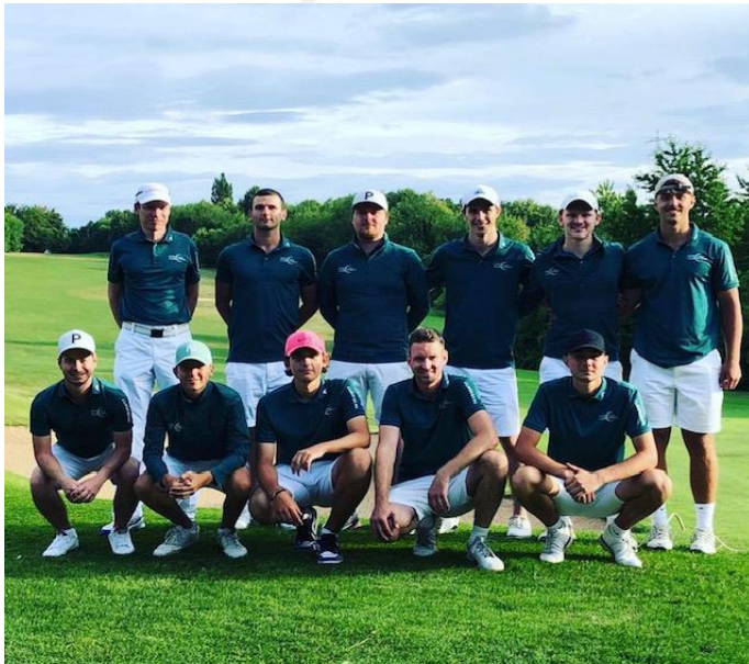
Herren I DGL: Regionalliga (3. Liga) BWMM: 1. Liga