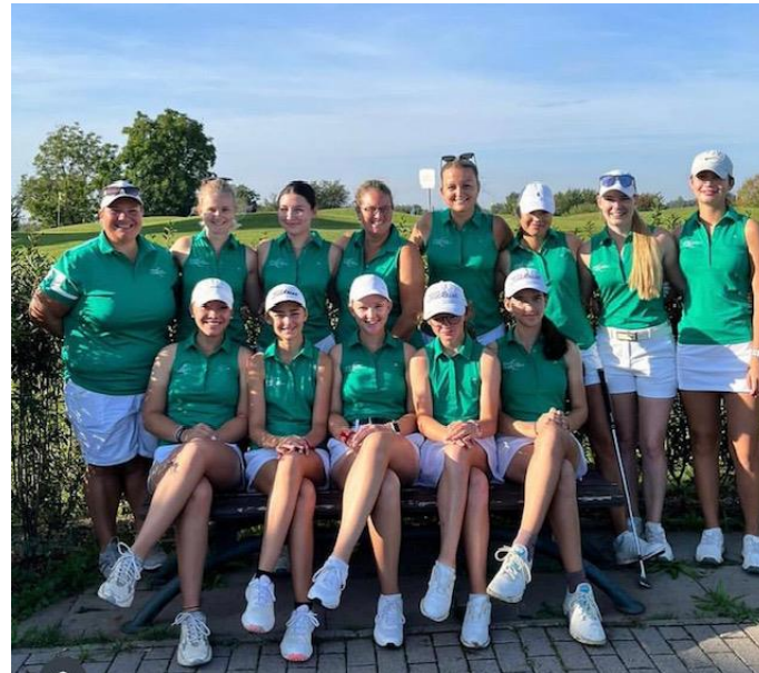
Damen DGL: Oberliga (4. Liga) BWMM: 2. Liga